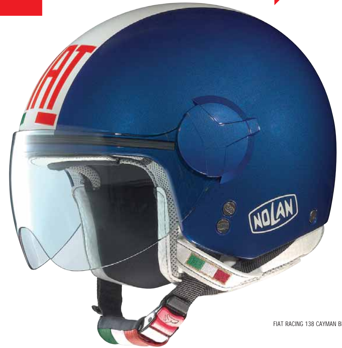
FIAT RACING 138 CAYMAN BLUE

N20 FIAT il Made in Italy elevato al quadrato per questa linea di caschi che vede accostati Nolan® e Fiat, entrambi marchi storici. La versione 500 rievoca la mitica automobile, riproducendone fedelmente il fronte ed il retro. La versione 500 EMOTICON può essere personalizzata utilizzando gli adesivi in dotazione, mentre la versione RACING propone il logo Fiat che da alcuni anni colora le piste della MotoGP. Su tutte le versioni è presente la bandiera italiana, un dettaglio importante che rimarca l'unicità di questa Collezione.